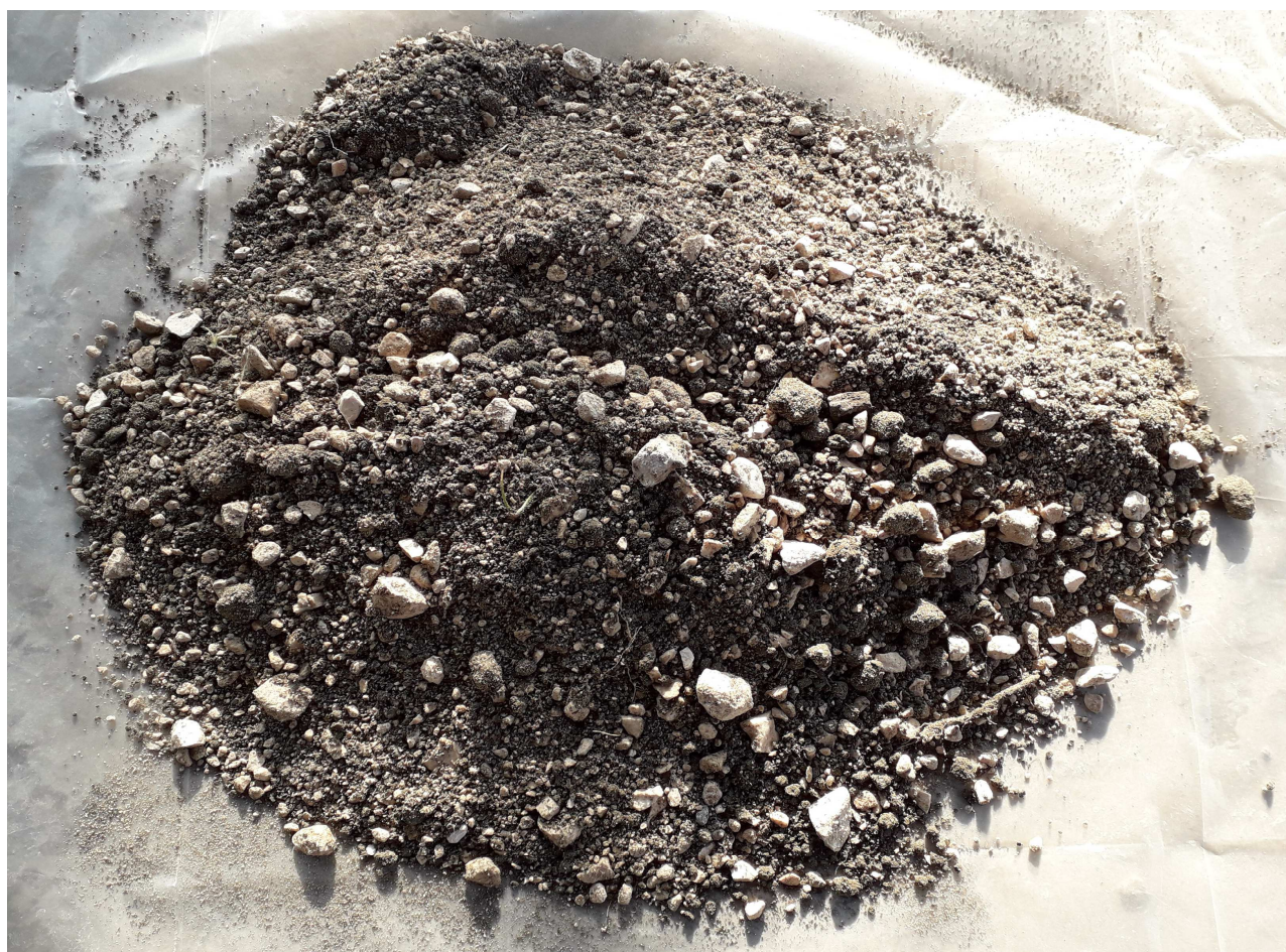
CAMPIONE MEDIO COMPOSITO